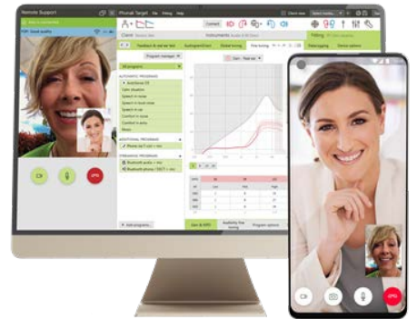
Phonak Remote Support via Phonak Target fitting software for the HCP and the myPhonak app for the client

포낙 원격 지원은 청각 전문가가 먼 거리에 있는 고객의 요구사항을 충족시킬 수 있도록 합니다. 고객은 마이포낙 앱을 통해 청각전문가의 도움을 받을 수 있습니다.