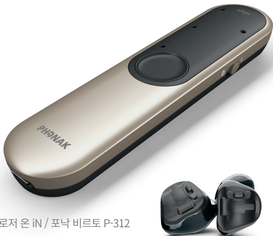
로저 온 iN / 포낙 비르토 P-312