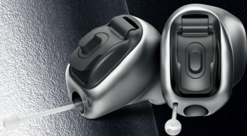
포낙 비르토 P-T