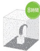
防塵テスト 8 時間

真水であれば濡れても乾燥させれば、再び音が出力され直接的な故障にはつながらない。