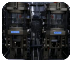
試験動画は QR へ

真水・塩水・塩素水・汗で濡れてもそのまま使用可能。 補聴器に水が染み入らないようコーティングやシーリングでハウジング強化。