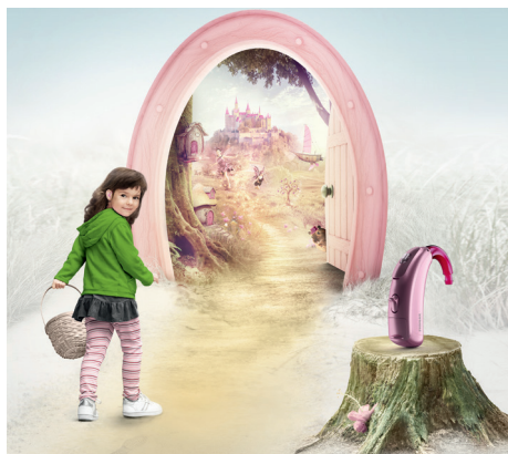
Die Ohren sind der Zugang zum Gehirn