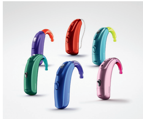
Sky B Hörgeräte sind in 14 Farben und 6 Modellen verfügbar

Phonak, der weltweit führende Hersteller von Hörlösungen für Kinder hat mit Phonak Sky B Lösungen entwickelt, die diesen Zugang öffnen und die Klänge klar hörbar machen. Das neue Portfolio bietet eine große Bandbreite an Hörgeräten für Kinder und Jugendliche mit leicht- bis hochgradigem Hörverlust. Es stehen sechs Modelle in robustem, wasserresistentem Gehäuse (Schutzgrad IP68) inklusive einer wiederaufladbaren Variante zur Verfügung. „Kinder und Jugendliche können zudem aus 14 Hörgerätekombis auswählen und so ihre Hörgeräte ganz nach ihrem eigenen Geschmack wählen und kombinieren“, erklärt der Experte Max Mustermann .