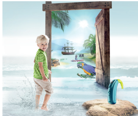
Junge Hörgeräteträger haben spezielle Bedürfnisse

Eltern von Kindern mit Hörminderung ist es besonders wichtig, dass die Hörlösungen leicht zu