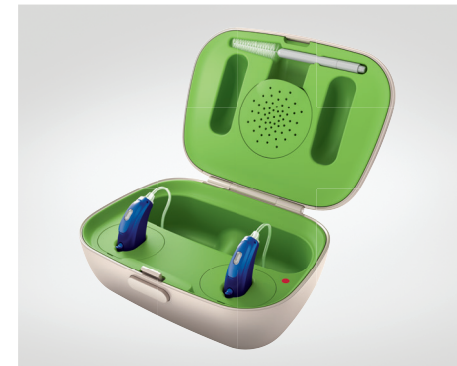
Phonak Sky B-PR mit wegweisender Akku-Technologie

tomatisch, sodass das Kind in jeder Umgebung die beste Hörleistung genießt. Besonders wichtig für die Sprachentwicklung eines Kindes ist der Zugang zum gesamten Klangspektrum. Mit der Funktion SoundRecover2 erfährt das Kind in jeder Umgebung automatisch die bestmögliche Klangqualität, damit es unbeschwert spielen und die Welt entdecken kann.