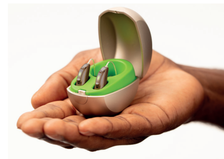
Das Mini Charger Case hat einen USB Ladeanschluss und passt in jede Tasche.

Phonak hat mit der Einführung von Lithium-Ionen-Akkus den Weg für wiederaufladbare Lösungen in der Hörgeräteindustrie bereitet. Die neuen Marvel