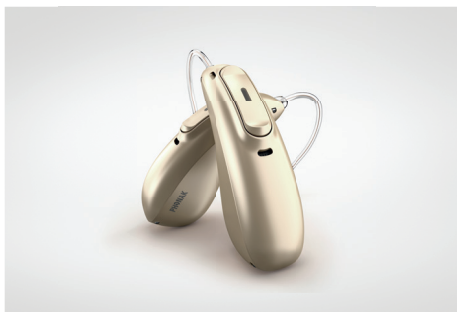
Audéo Marvel steht in verschiedenen Modellen und Farben zur Verfügung.

Alle Audéo M Modelle verfügen über AutoSense OS™ 3.0 und die Binaurale VoiceStream Technologie™. Sie werden in verschiedenen Modellen und 8 Farben angeboten, damit für jeden Geschmack und jeden Bedarf die passende Lösung gefunden werden kann. Selbstverständlich sind alle Gehäuse wasser- und staubresistent.