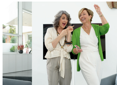
Das Telefonieren mit Audéo Marvel ist komplett freihändig möglich.

Die technische Landschaft, die den Alltag sowohl privat als auch beruflich beeinflusst, verändert sich immer schneller. Da ist es wichtig, dass die Hörgeräte auch bei Telefongesprächen, beim Fernsehen schauen und bei der Verbindung mit anderen elektronischen Geräten eine einfache und komfortable Lösung bieten.